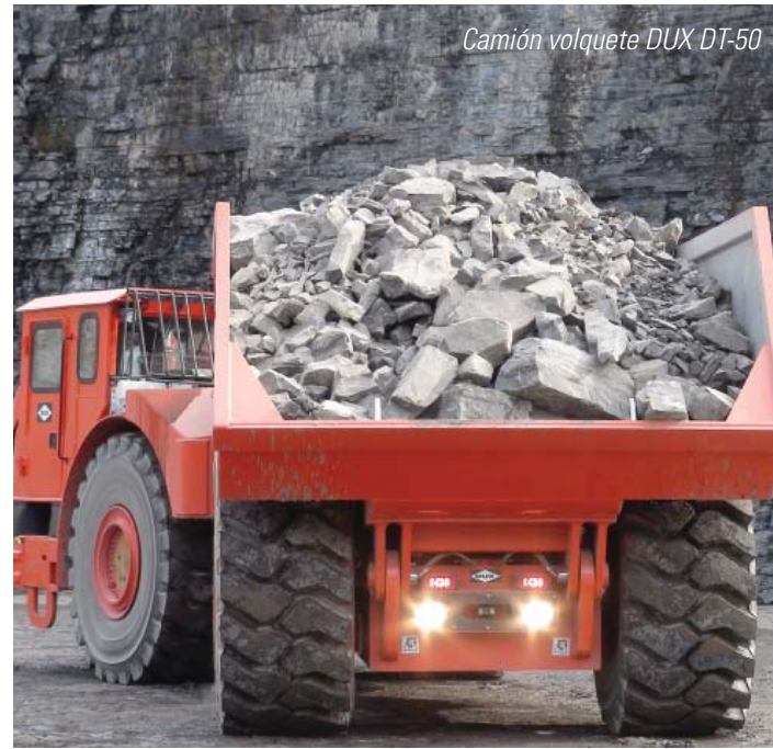
Camión volquete DUX DT-50