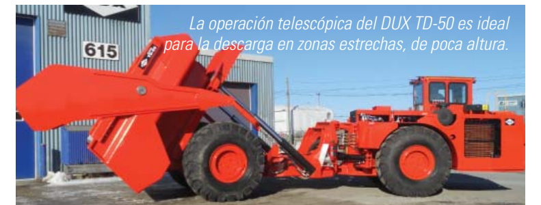
La operación telescópica del DUX TD-50 es ideal para la descarga en zonas estrechas, de poca altura.