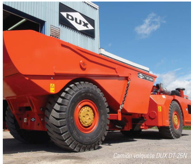
Camión volquete DUX DT-26N