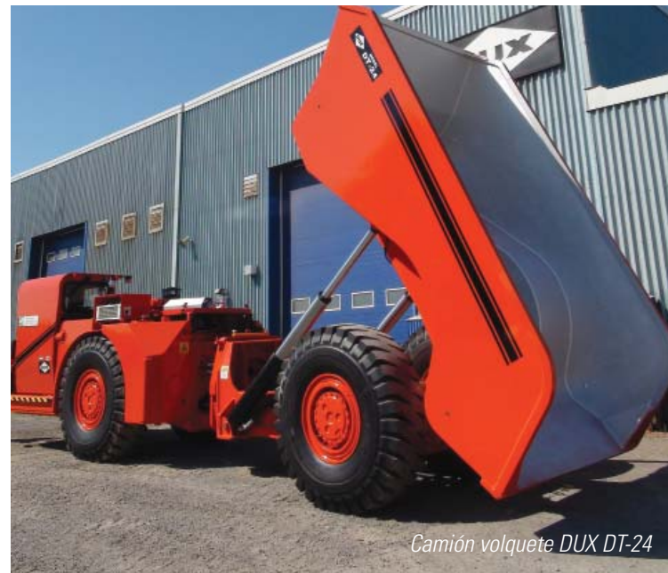
Camión volquete DUX DT-24