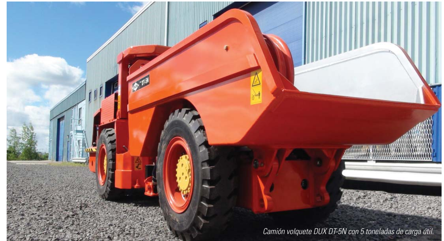
Camión volquete DUX DT-5N con 5 toneladas de carga útil.

DUX MACHINERY CORPORATION 615 Lavoisier, Repentigny, Québec Canada J6A 7N2