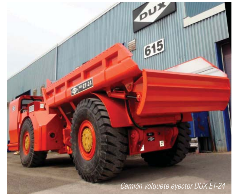
Camión volquete eyector DUX ET-24