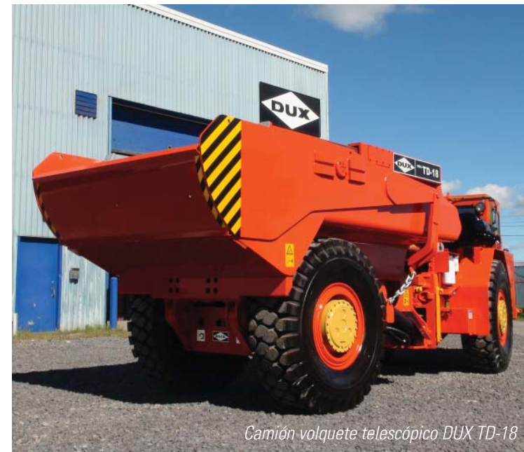
Camión volquete telescópico DUX TD-18