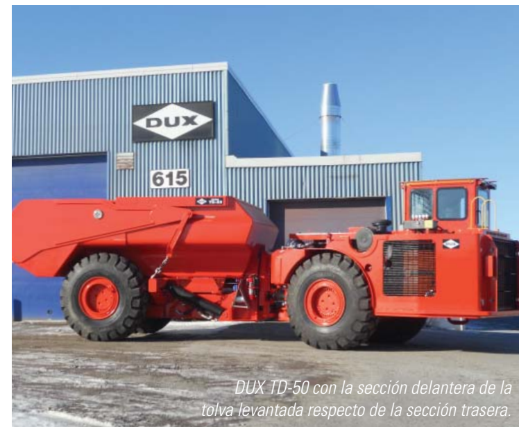
DUX TD-50 con la sección delantera de la tolva levantada respecto de la sección trasera.