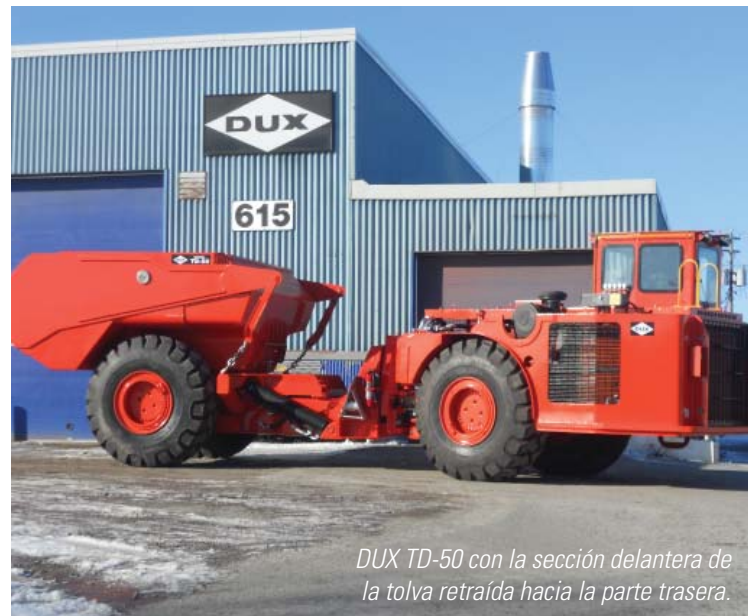
DUX TD-50 con la sección delantera de la tolva retraída hacia la parte trasera.