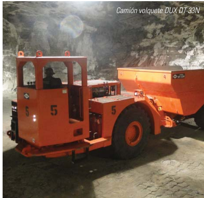
Camión volquete DUX DT-33N